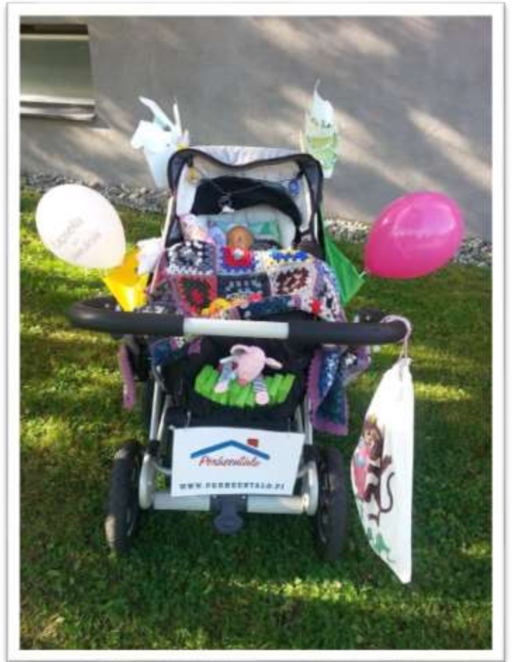
Perheentalon uudet "iloiset markkinointivaunut"