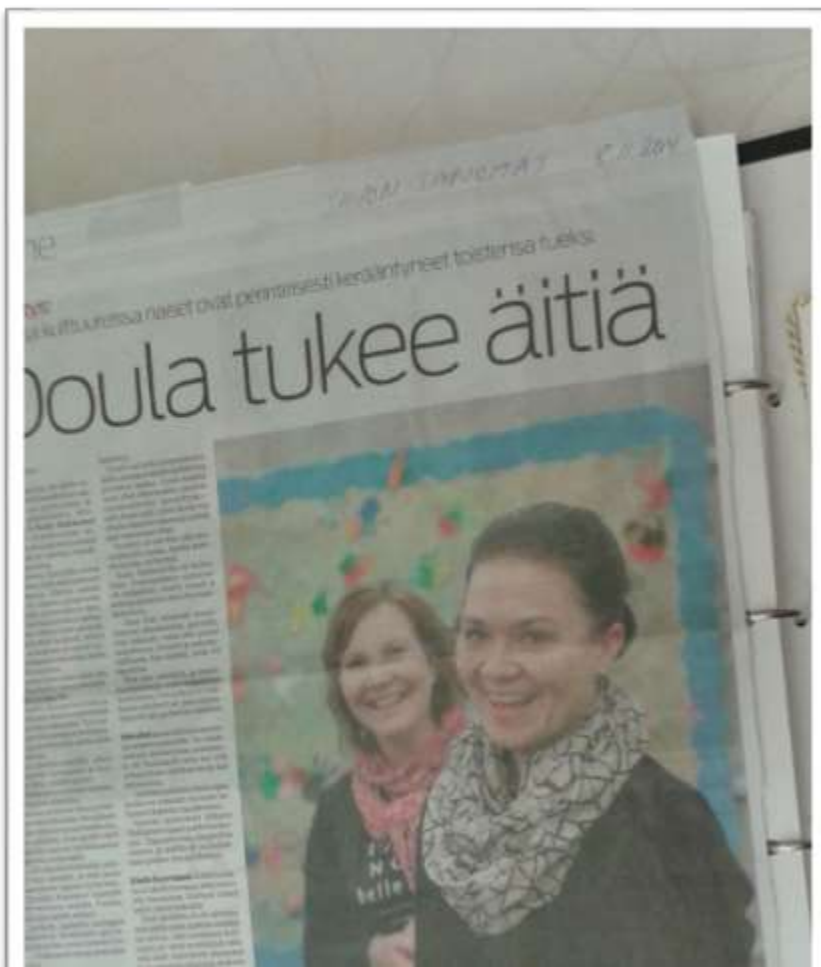
Lehtijuttu Savon Sanomissa 8.11.2014

Douloimintaan tuli uutta intoa kun keväällä saimme ensimmäisen doulasuhteen. Doulatoiminnan prosessia päästiin nyt kokeilemaan ja arvioimaan todellisessa tilanteessa. Onnistunut doulasuhde vahvisti sitä, kuinka tärkeästä toimintamuodosta on kyse ja että toimintaa on tärkeä jatkaa ja tiedottaa siitä eri tavoin. Vuoden lopussa saatiin alulle toinen doulasuhde. Vauva syntyi tammikuussa 2015.