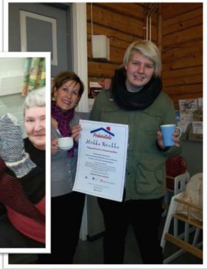
Tervetuloa Mokka Ronkkaan!

Lisäksi tehtiin kuntakierros kolmeen kuntaan, Vieremälle, Sonkajärvelle sekä Kiuruvedelle. Nämä kirjastoissa pidetyt illat toteutettiin yhteistyössä MLL:n paikallisyhdistysten kanssa. Iltojen tavoitteena oli lisätä Perheentalo –yhteistyön näkyvyyttä ja saada uusia vapaaehtoisia mukaan toimintaan. Kiuruvedellä ja Vieremällä on myös edetty Perheentalomallin suunnitteluvaiheeseen.