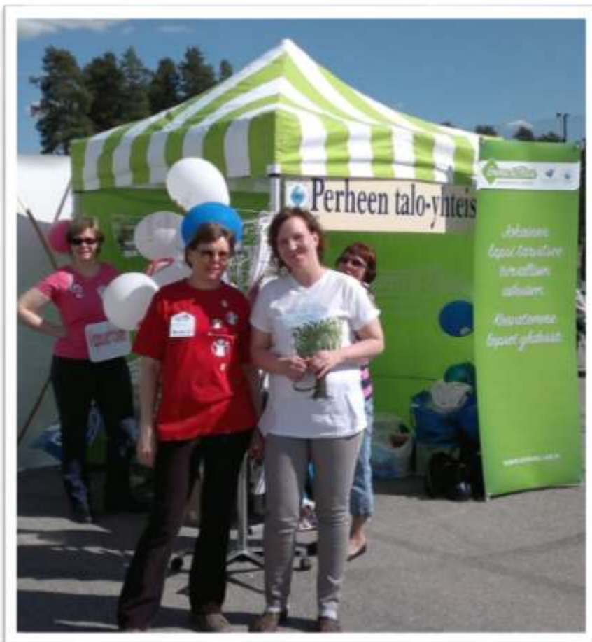
Kevätmessuilla riitti hulinaa!