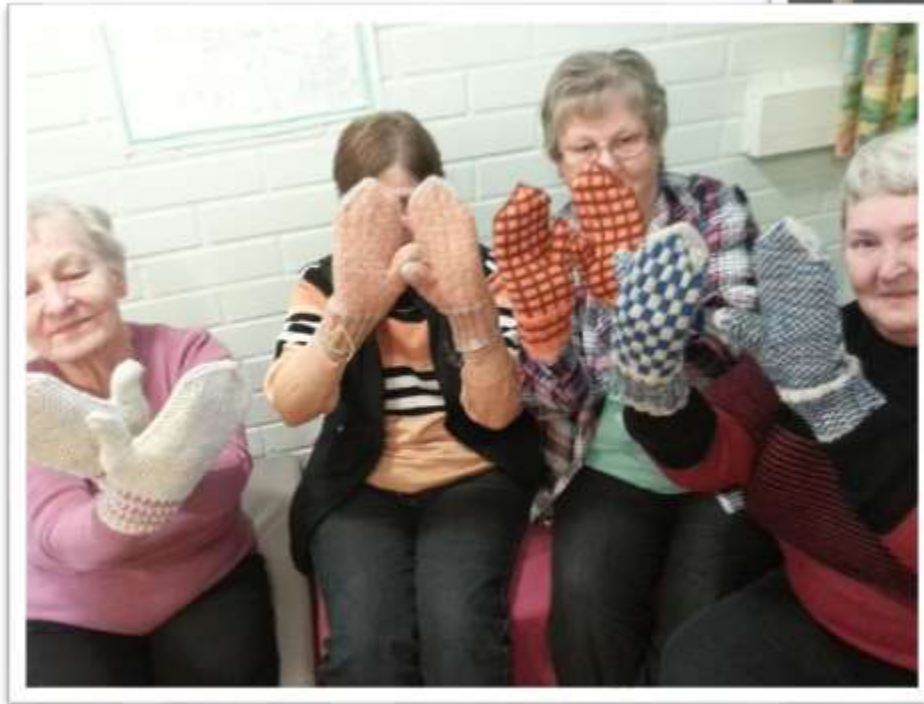
Mummojen Villasukkakampanjassa kudottiin noin sadat sukat